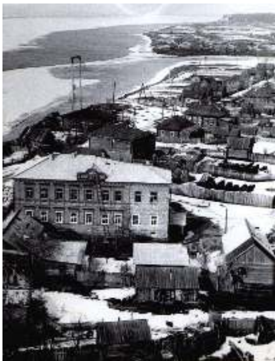
Николо-Берёзовка, северная прибрежная часть посёлка, 1970-е годы