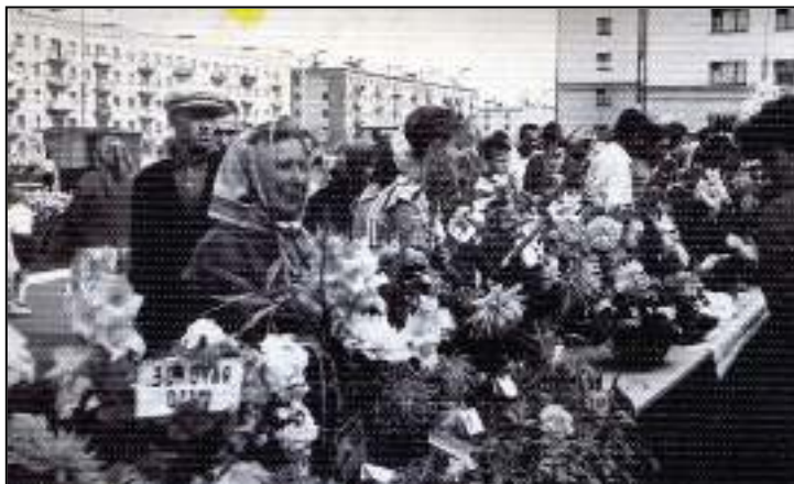
Первая выставка цветов. Площадь кинотеатра «Маяк», 1965 г.