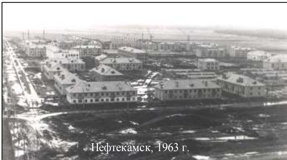
Нефтекамск, 1963 г.