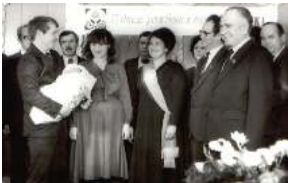
Чествование 100- тысячного жителя Нефтекамска. Ноябрь 1985 г.