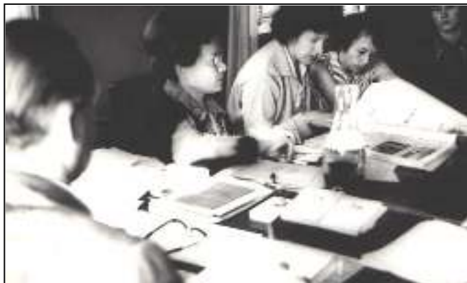
Планёрка в редакции газеты «Красное знамя», Август 1976 г.