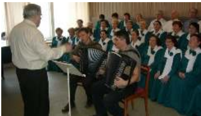
Нефтекамский городской хор ветеранов, 2007 г.

Рукою нежный пух ловлю. Любимый город тополиный, Тебя люблю, тебя люблю.... (2 раза)