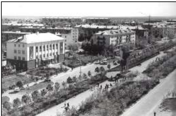
Проспект Ленина, 1980-е годы.