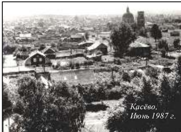
Касёво, Июнь 1987 г.