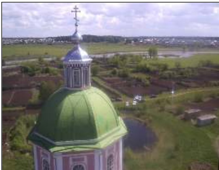
Пос.Николо-Берёзовка, вид с колокольни храма. 2006 г.