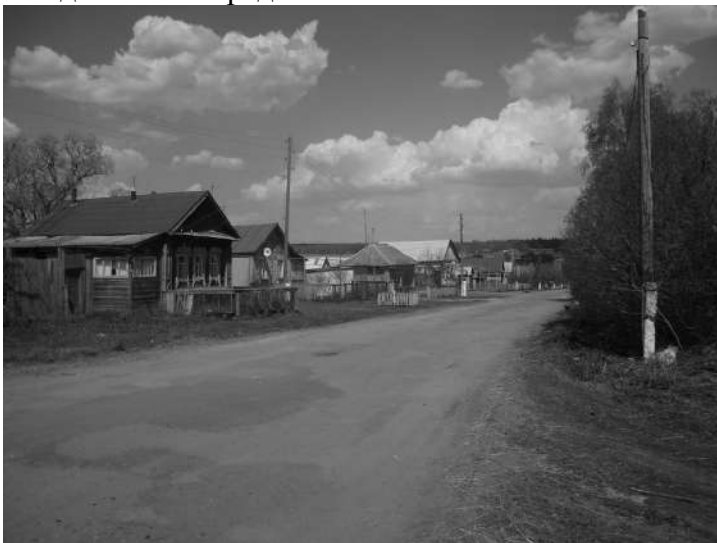
Старый Чирчим – Родина моих предков

По отцовской линии родных мы нашли лишь до четвертого колена, а по материнской линии – до седьмого. Корни мамы моей находятся в Пензенском крае. Белоствольные берёзки, бегущие вдоль дорог. Звонкие рощицы с трепетными осинками. Тенистые дубравы и бронзовые сосновые боры. Луга с белыми островками ромашек и прибоем синих колокольчиков. Поля – летом золотые, осенью – с дымкой, спаленной жнивы. Это всё Родина моих предков.