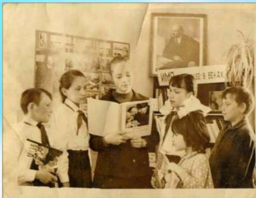
Первое мероприятие в детской библиотеке, 1976 год

В 1976 году окончила Татышлинскую среднюю школу №2 и уже в октябре этого же года начала работать библиотекарем районной детской библиотеки. А в 1977 году поступила на заочное отделение Казанского Государственного института культуры по специальности «Библиотековедение и библиография».