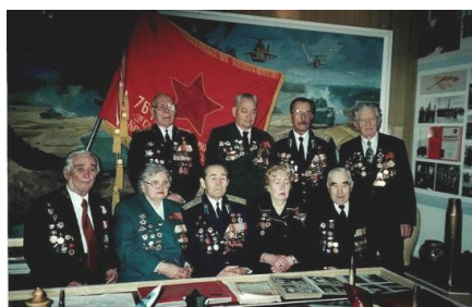
Встреча однополчан. Псков, 2000 год