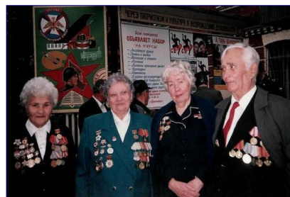
Встреча на 60-летию 76-й дивизии. 1999 год