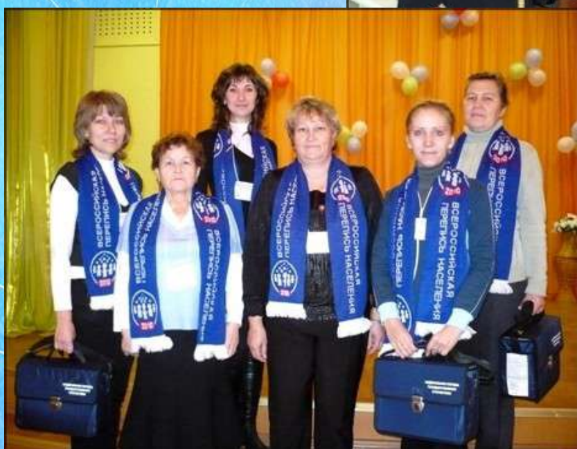
Всероссийская перепись населения, 2010 год