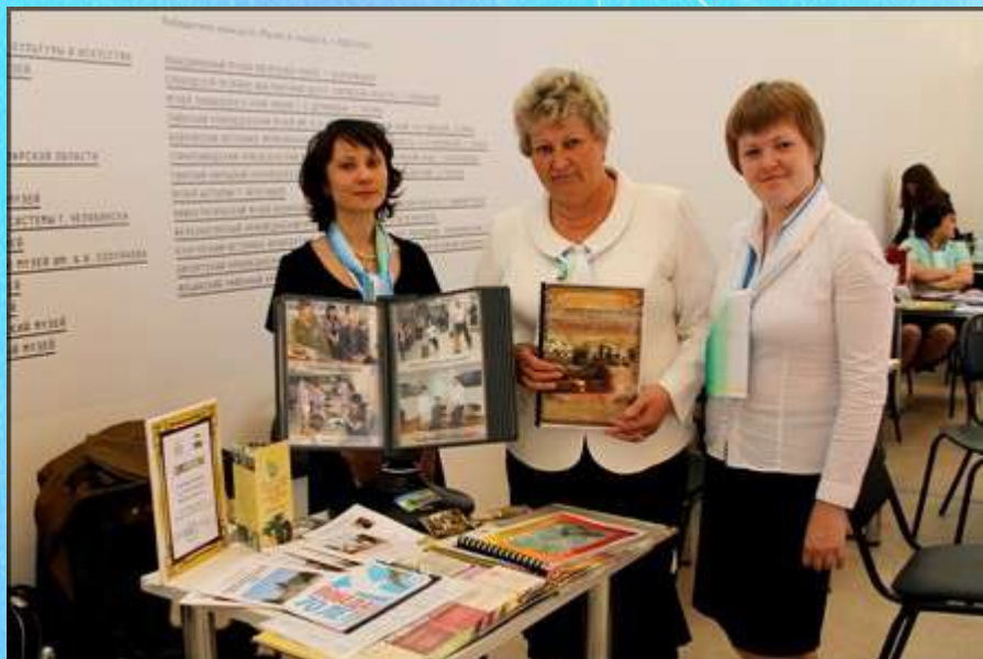
Интермузей, 2015 год г. Москва

Нефтекамский музей сегодня – один из крупнейших в республике и занимает лидирующее место. Согласно рейтингу самых популярных музеев Башкортостана в 2017 году Нефтекамский историко-краеведческий музей вошел в двадцатку лучших из 1076-ти музеев республики. По итогам года музей награжден памятным знаком администрации городского округа г.Нефтекамск «Творческий поиск и энтузиазм».