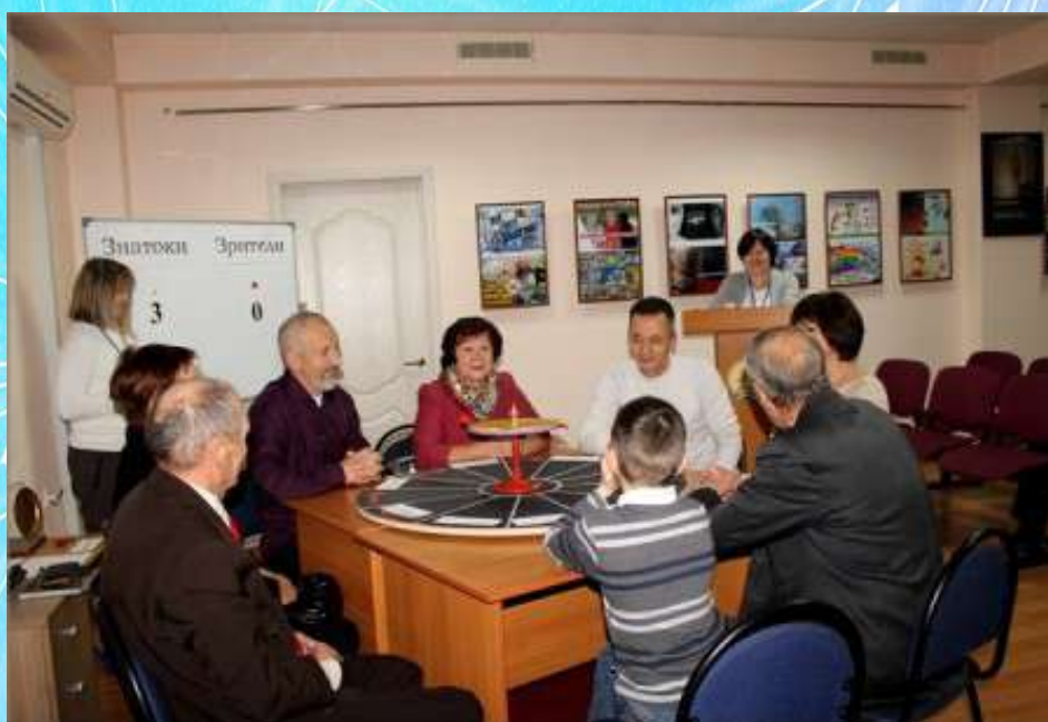
Ночь искусств, 2018 год