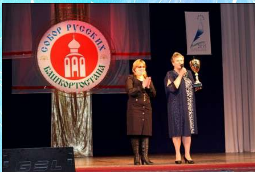
Передача кубка удмуртскому национальному центру