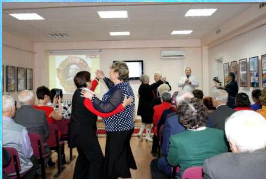
Комсомол в судьбе страны, 2018 год