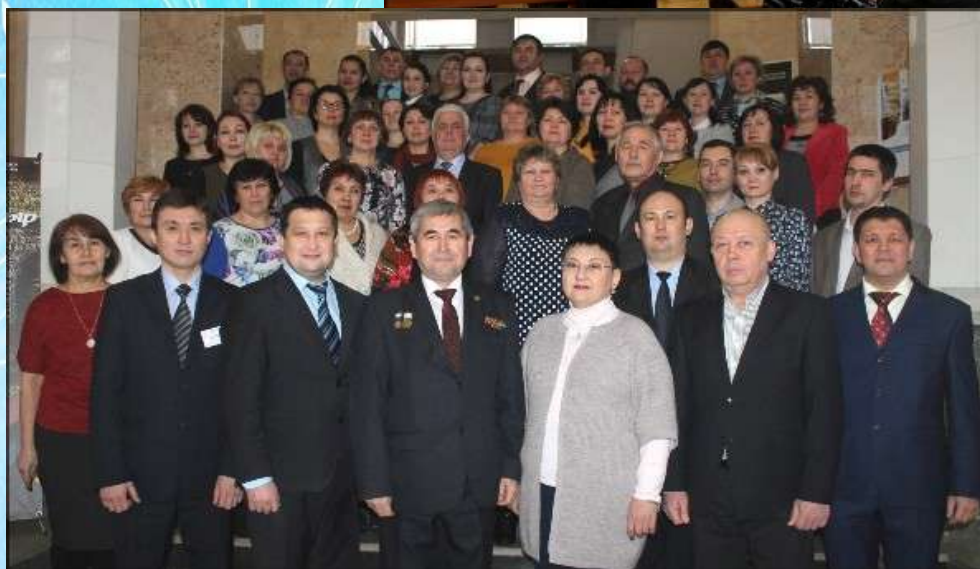
Совещание директоров, 2017 год