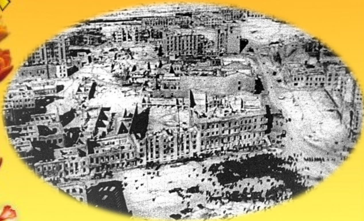
Сталинград 1942 год