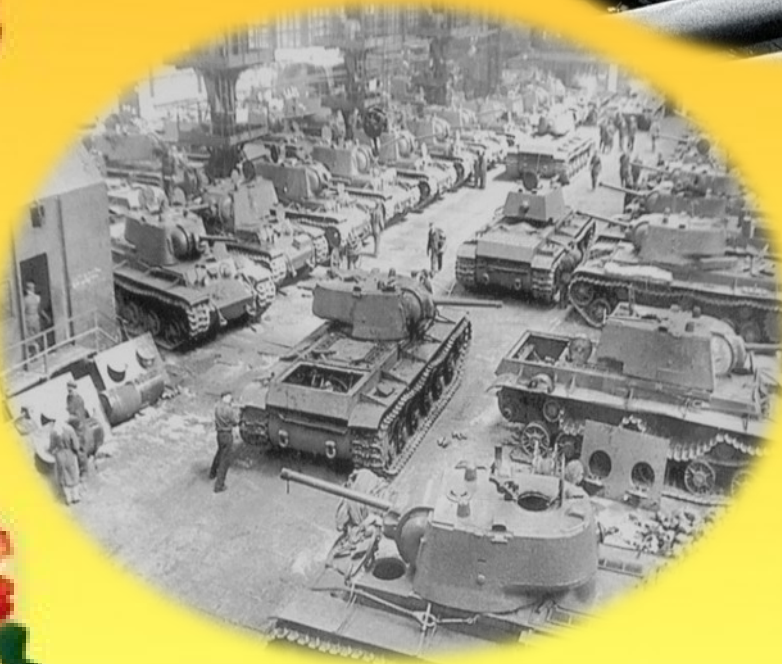
Сборочный цех танков КВ-1 Челябинского Кировского завода