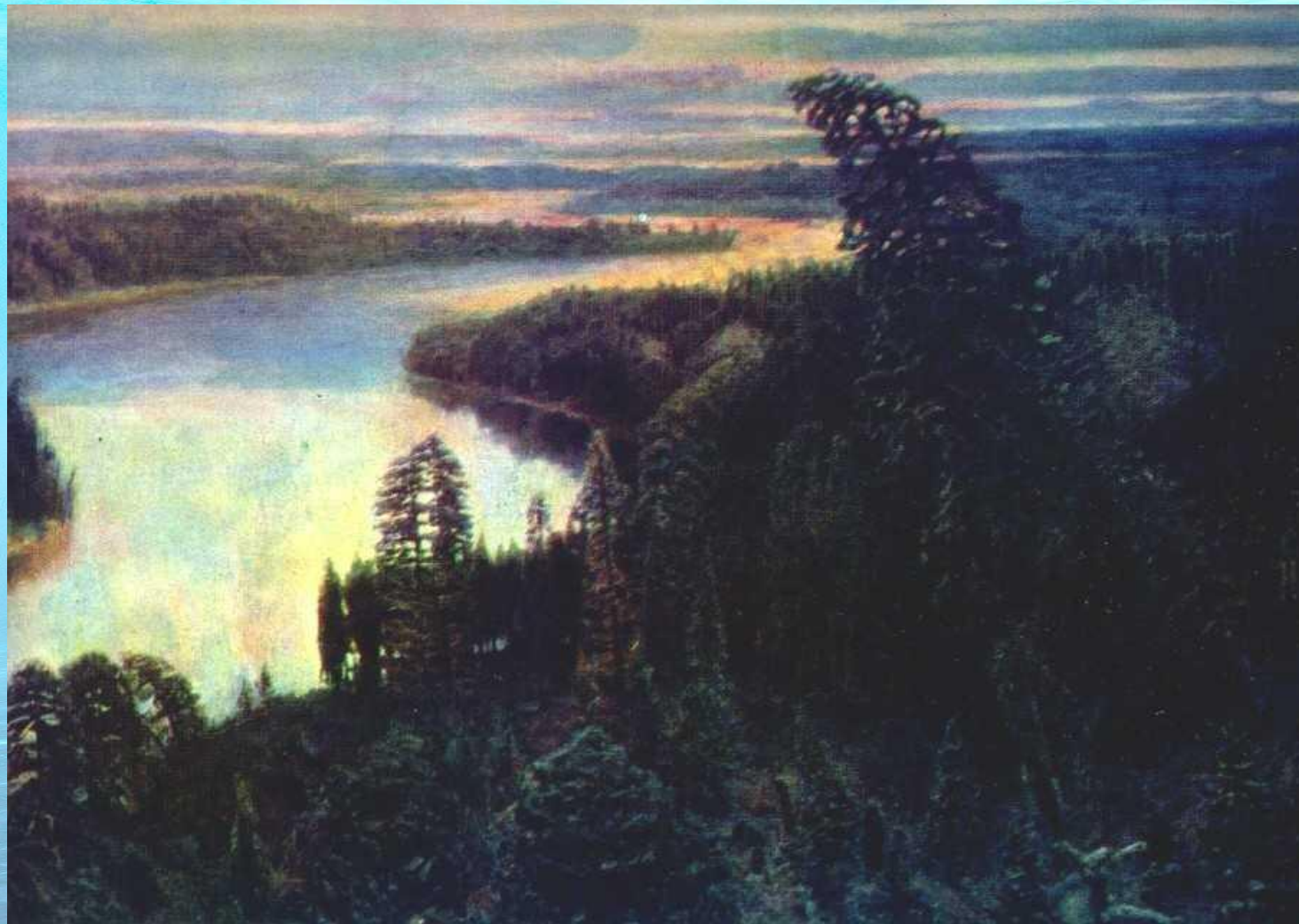
А.М. Васнецов «Северный край»