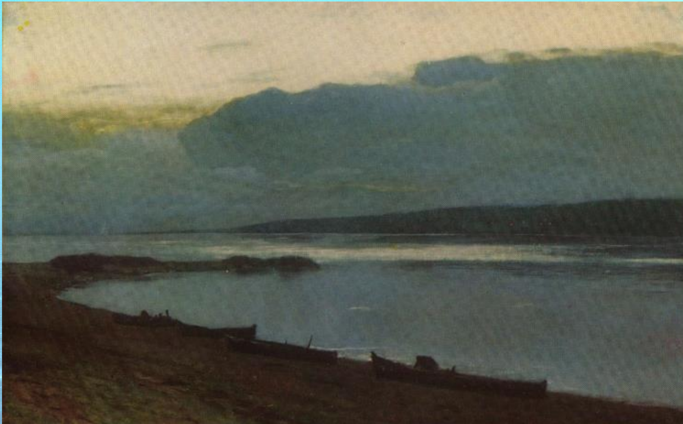
И.И. Левитан «Вечер на Волге»