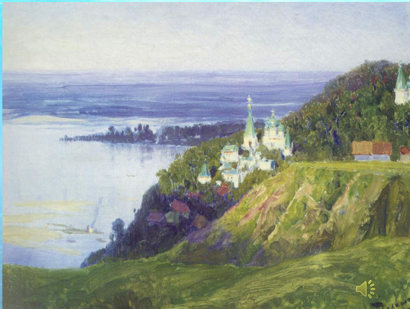
В.Д. Поленов «Монастырь над рекой»